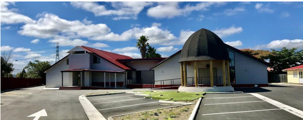
Malumalu EFKS Takanini, I ONA TULAGA AAO, & Le Rosa Samoa Takanini Community Hall