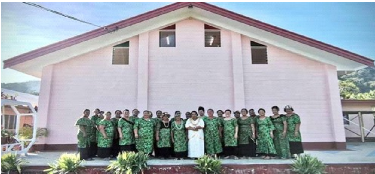
Faletua o Sinuanua F. Nefu & Mafutaga Tina EFKS Alamagoto i luma o le Maota fou

FAAPAIA MAOTA O LE GALUEGA EFKS ALAMAGOTO