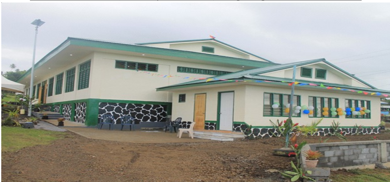
Maota o le Galuega - EFKS Salelologa Hall