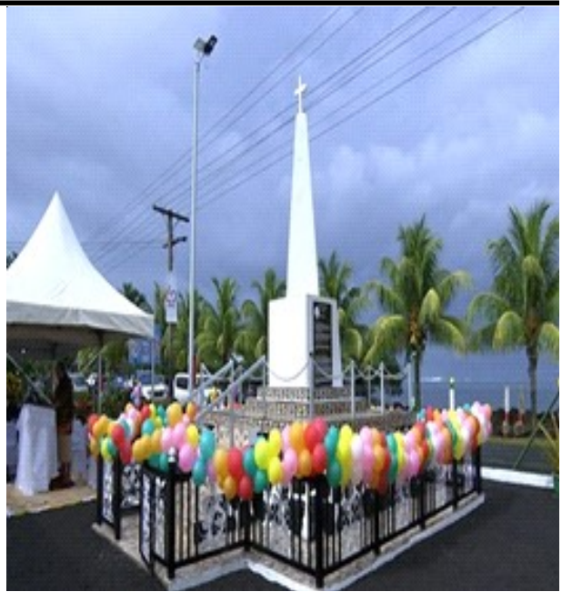
MAA FAAMANATU, FALE LOMITUSI