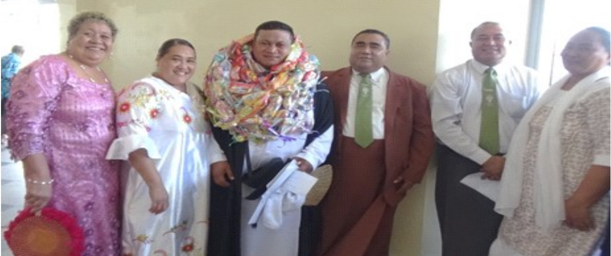
Filifili Malifa AM, se tasi o le au faau'u, faatasi ma matua, Ekalesia ma aiga sa tapuai

32 FAAU'U MAI LE KOLISI FAAFAIFEAU MALUA 2022