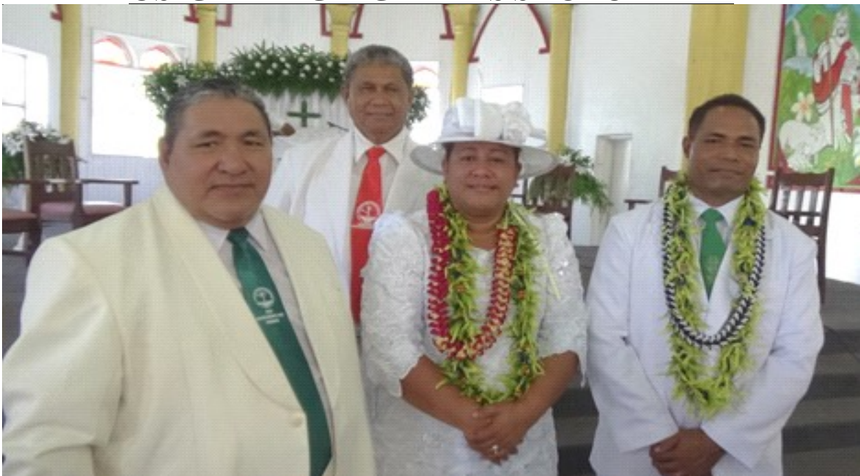
Susuga Misipalauni Faatau FT, ma le Faa-feagaiga EFKS Saoluafata, Onosa'i Soo FS & Toafa