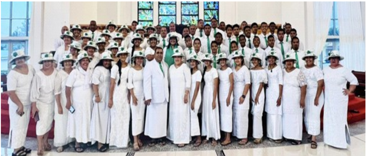
TA'ITA'I LOTU AU LEOLEO & AUFAlPESE EFKS ULULOLOA & SIUSEGA