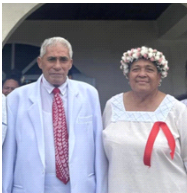
SUSUGAALESANA FS & FAASASALU