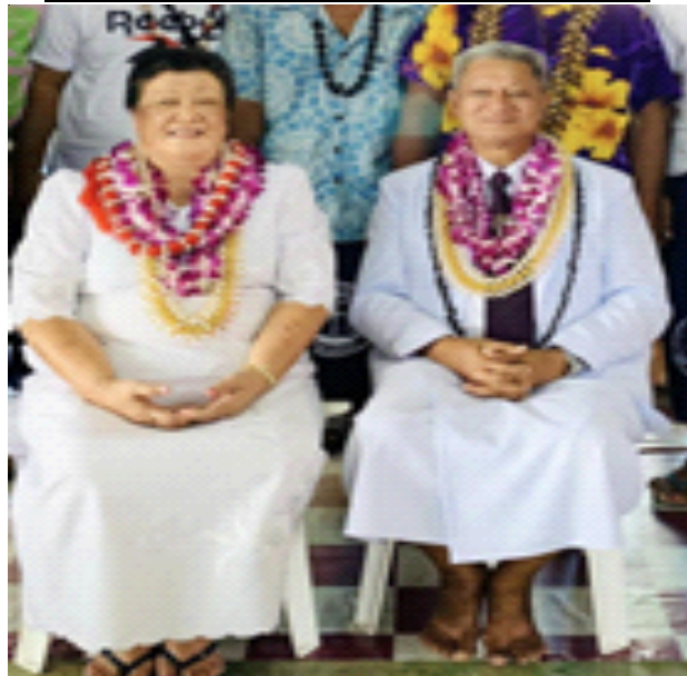
VAIGALO MAUA FT & PETIMARA