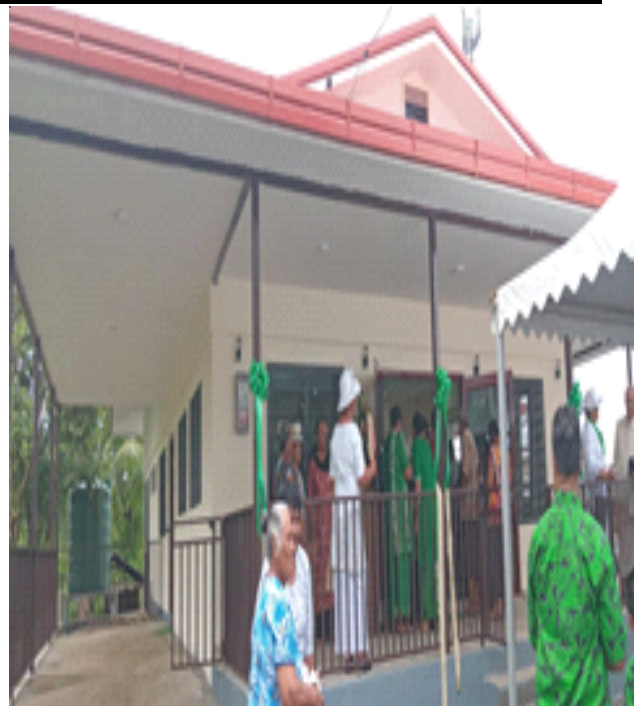
Le Maota Fou Faafeagaiga Sinamoga