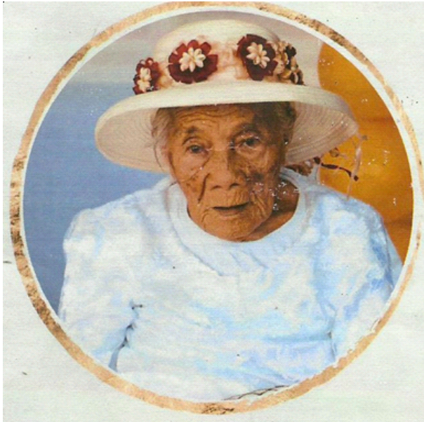
I. LENIU AVAONA FANENE