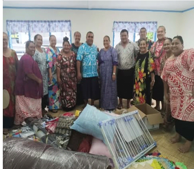
Vaaiga masani i soo se Aulotu i le Faamati