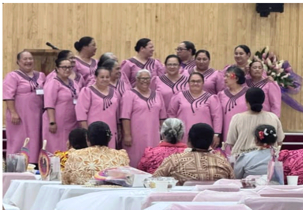
Vaaiga masani Mafutaga Tina EFKS