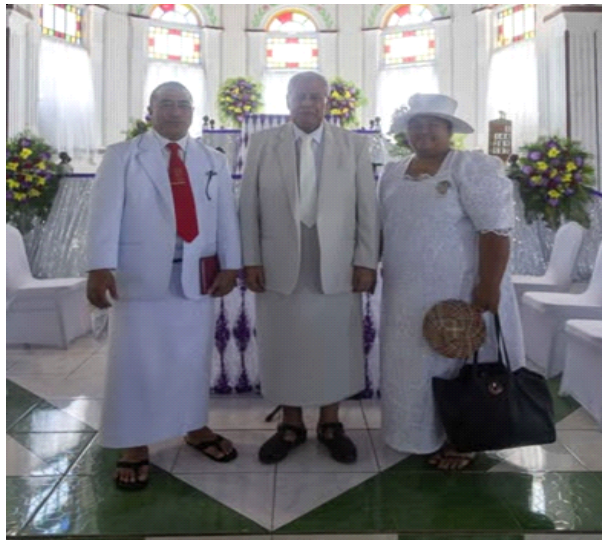
Ao Mamalu o le Malo ma lana Faafeagaiga